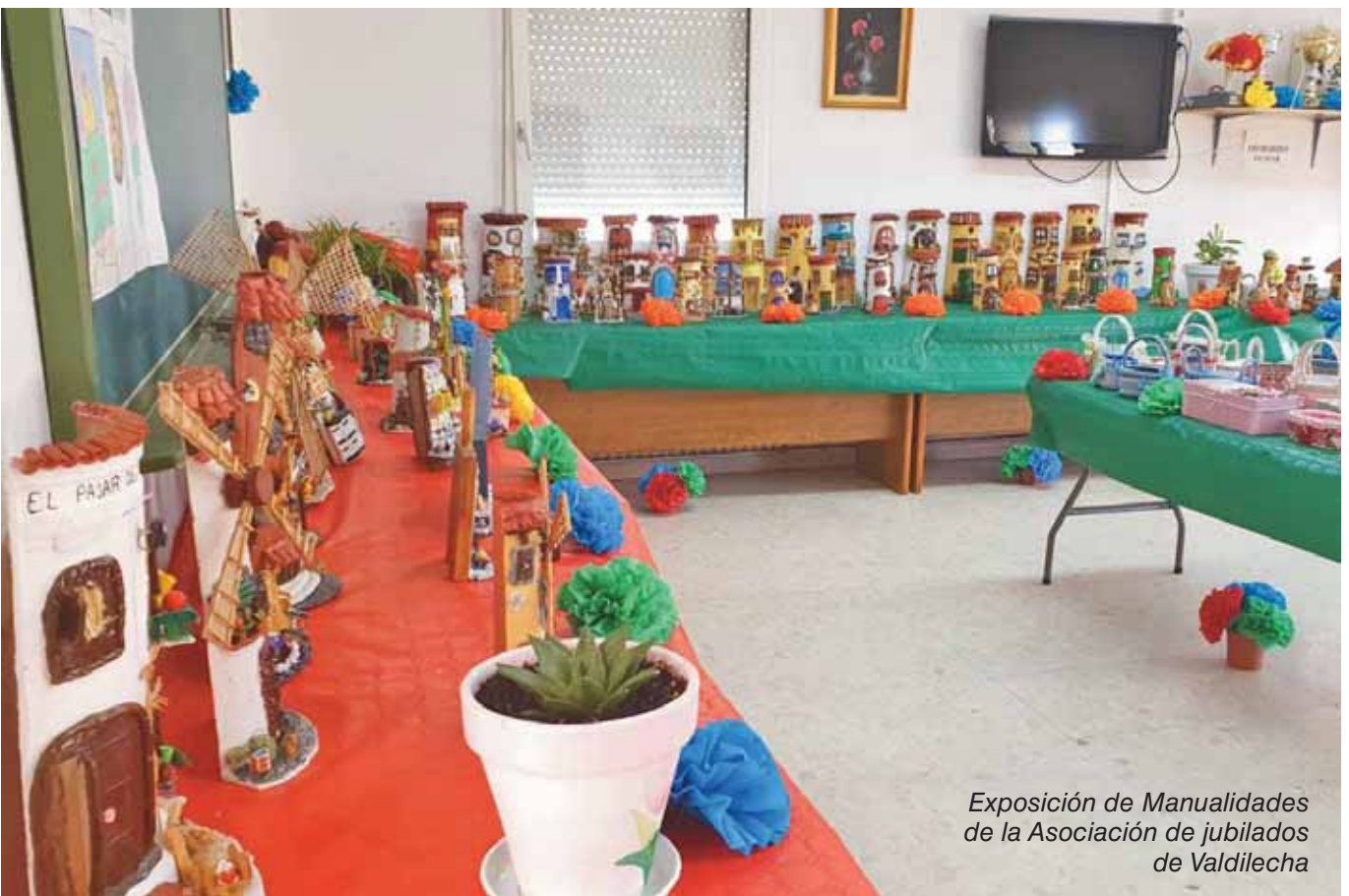
Exposición de Manualidades de la Asociación de jubilados de Valdilecha